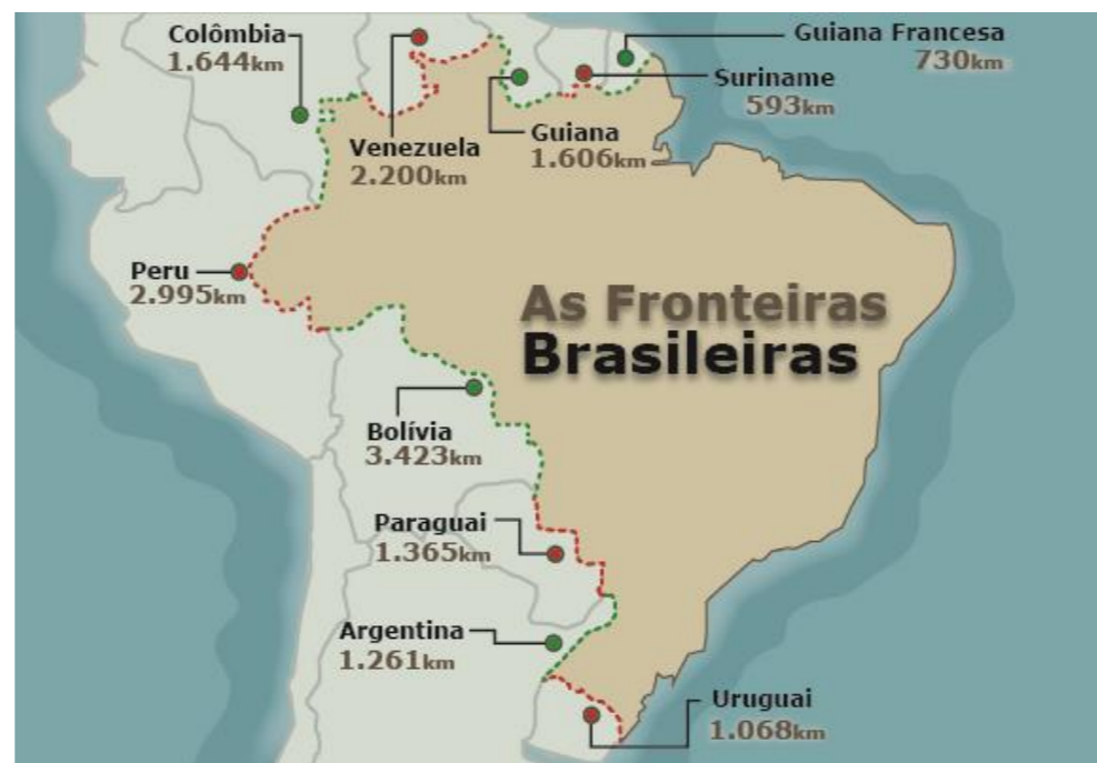
Mapa 1 – Fronteiras do Brasil